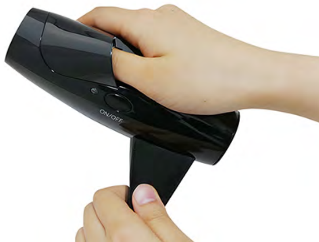
疲労ストレス計（村田製作所製）